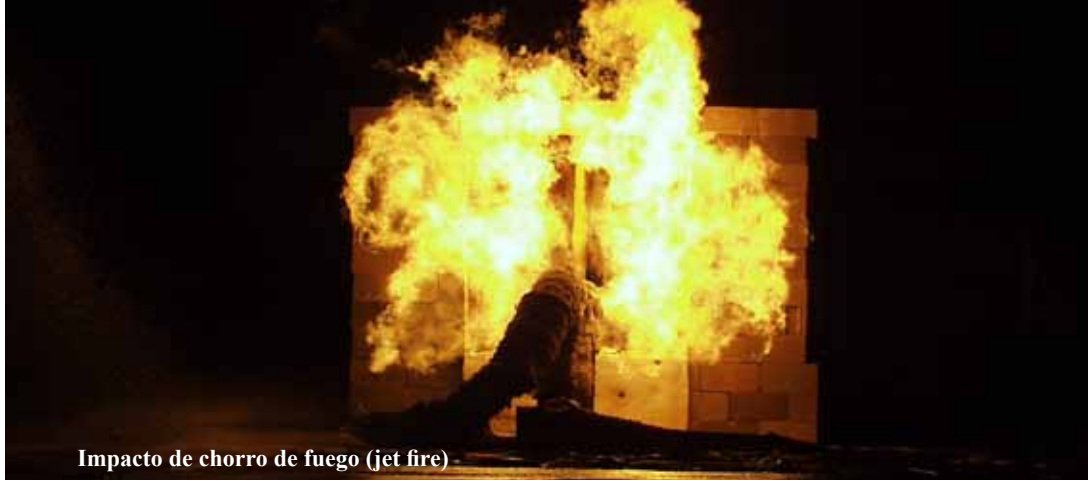
Impacto de chorro de fuego (jet fire)