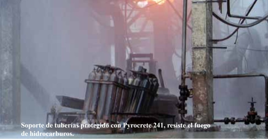
Soporte de tuberías protegido con Pyrocrete 241, resiste el fuego de hidrocarburos.