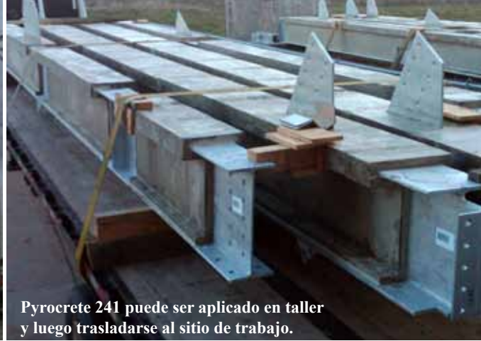
Pyrocrete 241 puede ser aplicado en taller y luego trasladarse al sitio de trabajo.